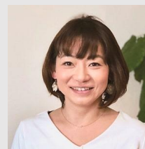
デザイナー 小沼景

築40年越えの築古マンション。 3DKの昔ながらの間取りから、収納と明るさを重視したリノベーション。オーナーさまが女性であり、施工後には、女性の入居者さまに貸し出しをしたいということで、女性の空間収納プランナーと一緒に、暮らしやすい収納豊富でインテリアのし易い間取りをご提案させていただきました。